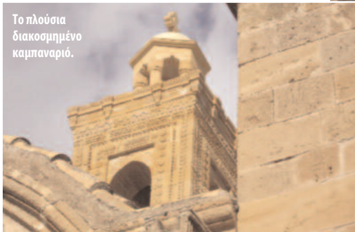
Το πλούσια διακοσμημένο καμπαναριό.

βλίο αναφέρεται ότι ο ναός «υπήρξε κάποτε μοναστηριακός».