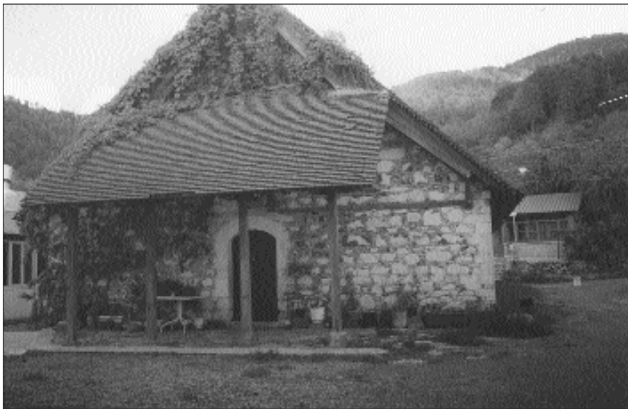
Ἡ δυτικὴ εἴσοδος τοῦ ναοῦ τῆς Μονῆς μέ τὸ διασωθέν τμῆμα τῆς βεράντας του.

Ἦς ἐμβλέψῃ πρὸς τὰ κάτω ὁ Θεὸς διὰ τοῦ πλούτου καὶ τῆς καλwsύνῃς Αὐτοῦ ἐπὶ τῶν πτωχῶν καὶ καταπιεζομένων Χριστιανῶν καὶ ἅς δώσῃ εἰς τὸν λαόν βοήθειαν καὶ δύναμιν δι' ἀνακαίνισιν [τῆς μονῆς], διότι ἐρείπια μιᾶς μοναχικῆς κατοικίας, τὰ ὅποια εὐρίσκουν ἑαυτὰ εἰς τοιαύτην θαυμασίαν τοποθεσίαν, προξενοῦν τὴν μεγίστην λύπην. Ἦκουσα ὅτι ἡ μονὴ αὕτη ἦτο ἀρχικῶς μεγάλη καὶ περίφημος ὡς ἡ τοῦ Κύκκου καὶ εἶχε πολλοὺς μοναχοὺς, ἀλλ' ἀργότερον ἐξέπεσεν εἰς μεγάλην πτωχείαν, λόγῳ τῆς πτωχείας τῶν μοναχῶν, προξενηθείσης ὑπὸ τῶν ἀνυποφόρων