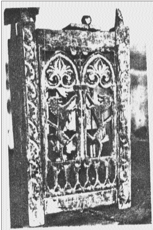
Τό τετράπλευρο ξύλινο ἀναλόγιο γιά ἀρτοκλασίες μέ τούς δύο γλυπτούς ὄρθιους λέοντες στήν κάθε πλευρά του.

Στή Μονή τῆς Τρικουκιάς ὑφίσταντο ἄλλοτε καί μερικά χειρό- γραφα, ὡς καί διάφορα παλαιά ἐκκλησιαστικά βιβλία, πολύ ἐνδιαφέροντα γιά τά σημαντικά ἱστορικά σημειώματα, πού εἶχαν