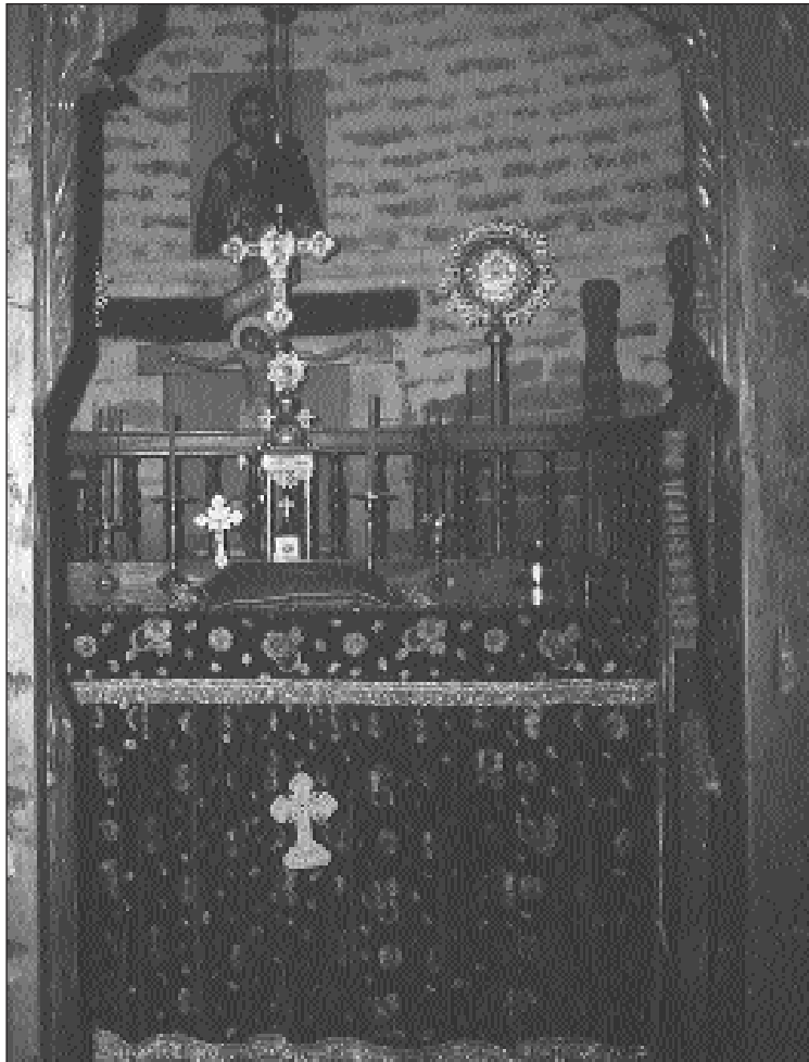
Ἡ Ἁγία Τράπεζα στό ἱερό βῆμα τοῦ ναοῦ τῆς Μονῆς.

Σήμερα σώζεται, όπως σημειώσαμε και προηγουμένως, ο επιδιορθωμένος (1761) παλαιός ναός τῆς Μονῆς Παναγίας τῆς Τρικουκιάς, ὁ ὁποῖος εἶναι τρίκλιτος μέ ξύλινη καί ἐπικλινή τή στέ-