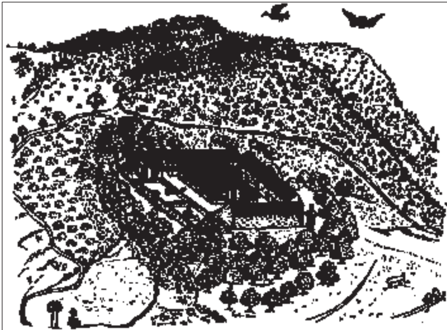
Ἡ Μονὴ Παναγίας τῆς Τρικουκιάς ὅπως τὴν σχεδίασε ὁ Βασ. Μπάρσκυ (1735).

αὐτόν καί ἄνευ ἐσωτερικῆς ὠραιότητος, ἐκτός ἀπὸ μίαν εἰκόνα τῆς ἁγίας Παρθένου, ἣτις ἦτο τό μόνον νέον ἀντικείμενον, ἐνῶ ὅλα τὰ ὑπόλοιπα ἦσαν πεπαλαιωμένα καί μαῦρα ἀπὸ τὴν πολυκαιρίαν. Αἱ εἰσοδοὶ εἰς τὴν μονὴν ἦσαν πολυάριθμοι διότι οἱ τοῖχοι ἦσαν κατεστραμμένοι εἰς πολλά μέρη. Ἡ κυρία εἰσοδος εἶναι εἰς τὸν βόρειον τοῖχον... καί ἔμπροσθεν αὐτῆς, ἐκτός τῆς μονῆς, εἶναι μία πηγὴ ὑγιεινοῦ ὕδατος, τό ὅποιον εἶναι θερμόν τὸν χειμῶνα καί ψυχρόν ὡς ὁ πάγος τό θέρος. Πρὸ τῆς μονῆς εἶναι μία ὑπερμεγέ-