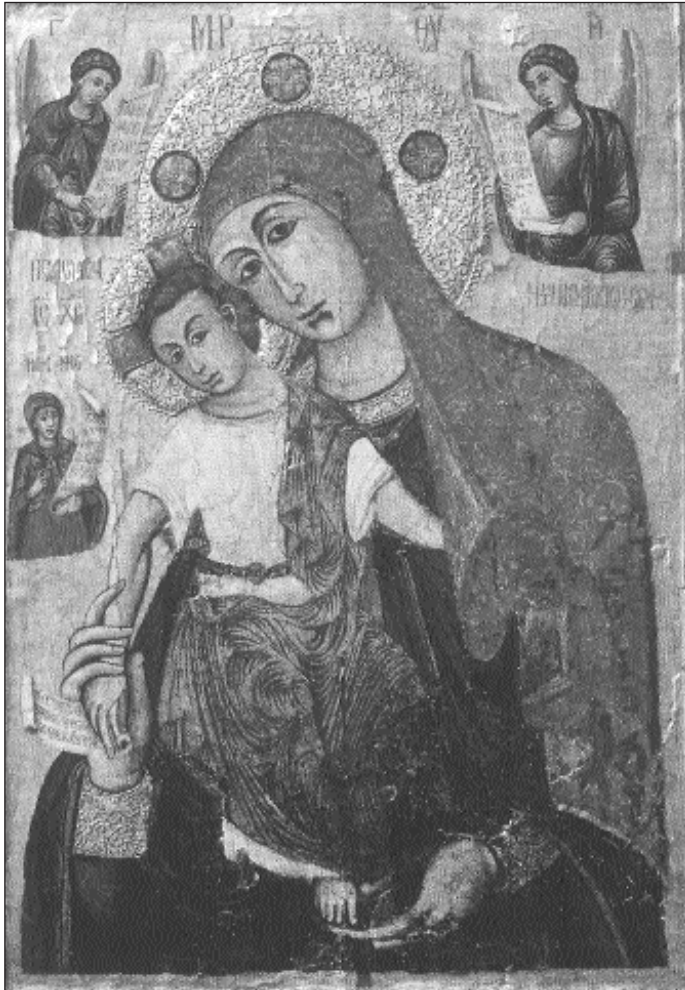
Ἡ εἰκόνα τῆς Παναγίας Ἐλεούσας τῆς Τρικουκιάς (17ος αἰώνας).

τοῦ Προδρόμου, Ἰωάννη τοῦ Θεολόγου, Ἰωάννη τοῦ Χρυσοστόμου, Γεωργίου, Δημητρίου καί Σπυρίδωνος, τῆς ἴδιας περίπου ἐποχῆς καί τεχνοτροπίας μέ ἐκείνας τῆς εἰκόνας τῆς Παναγίας.