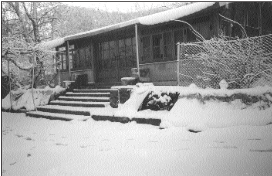
Τό νέο κτίσμα στά ἀνατολικά τῆς Μονῆς, τό όποίο χρησιμοποιεῖται ὡς βιβλιοπωλεῖο καί ἐργαστήριο.

Στό μεταξύ, στίς 3 Ὀκτωβρίου 1989, ἡ Ἱερά Ἀρχιεπισκοπή ἀγόρασε τή Μονή Τρικουκιάς ἀπό τή Μητρόπολη Μόρφου, στήν ἰδιοκτησία τῆς όποίας εἶχε περιέλθει μετά τό χωρισμό της ἀπό τή Μητρόπολη Κυρηναίας (13 Αὐγούστου 1973). Τό 1997 (14 Σεπτεμβρίου) ἡ Ἱερά Ἀρχιεπισκοπή επέτρεψε τήν ἐγκατάσταση